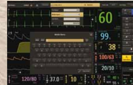
Gestión de casos

Las funciones de gestión de casos proporcionan un acceso rápido y conveniente para el procesamiento del paciente, incluida la admisión y el alta que se optimizan mediante el escáner inalámbrico de código de barras y hacen que sea fácil enlazar con el sistema de información del hospital para una gran eficiencia. También puede congelar la forma de onda del ECG y marcar un evento para realizar anotaciones impresas.