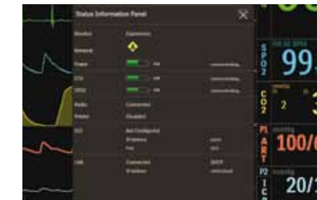
Información general sobre el estado

La configuración de usuario editable le permite personalizar y almacenar varias configuraciones para diferentes procedimientos, tipos de pacientes y usuarios, además de seleccionar convenientemente una durante el encendido o durante la operación. Todos los ajustes también se pueden guardar para compartir con el sistema anfitrión de monitoreo de pacientes.