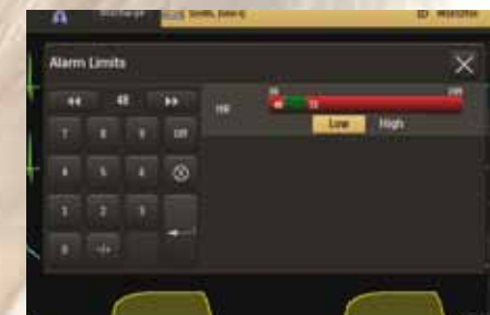
Gestión de alarmas

Expression IP5 admite información e informes de tendencias flexibles y análisis avanzado de tendencias. Puede mostrar flechas que indican la dirección de los signos vitales de un paciente, configurar las indicaciones de tendencia mostradas y acceder fácilmente a los datos de tendencias del paciente.