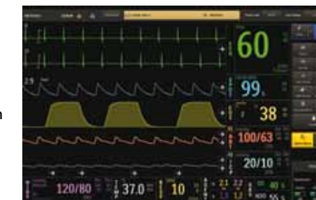
Agradable de usar

Un cuadro de información general sobre el estado muestra de un vistazo que todos los elementos de su sistema de supervisión Expression funcionan correctamente. Visualiza información acerca de todo, desde la carga de la batería del monitor hasta la impresora y la conectividad, para ayudarle a evaluar rápidamente el estado de su sistema.